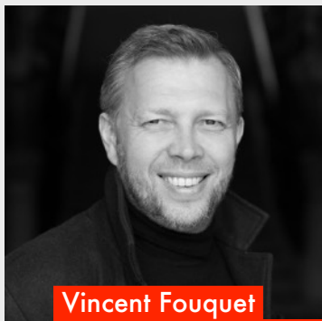
Vincent Fouquet texte et mise en scène

Né en 1969 en Normandie, Vincent Fouquet vit aujourd'hui en banlieue lyonnaise. Après des études universitaires en Lettres et une formation théâtrale au